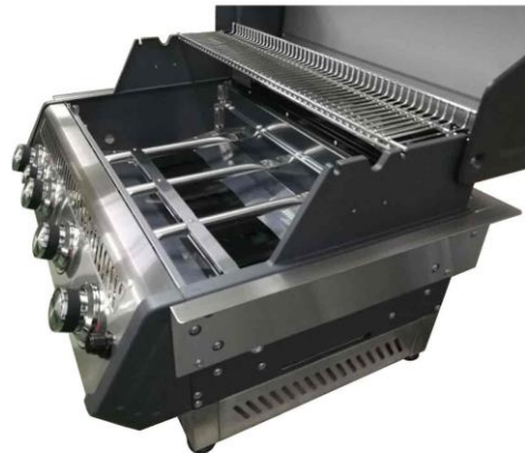
Datenblatt „Maße“ Gasgrill SANTOS Free S-410